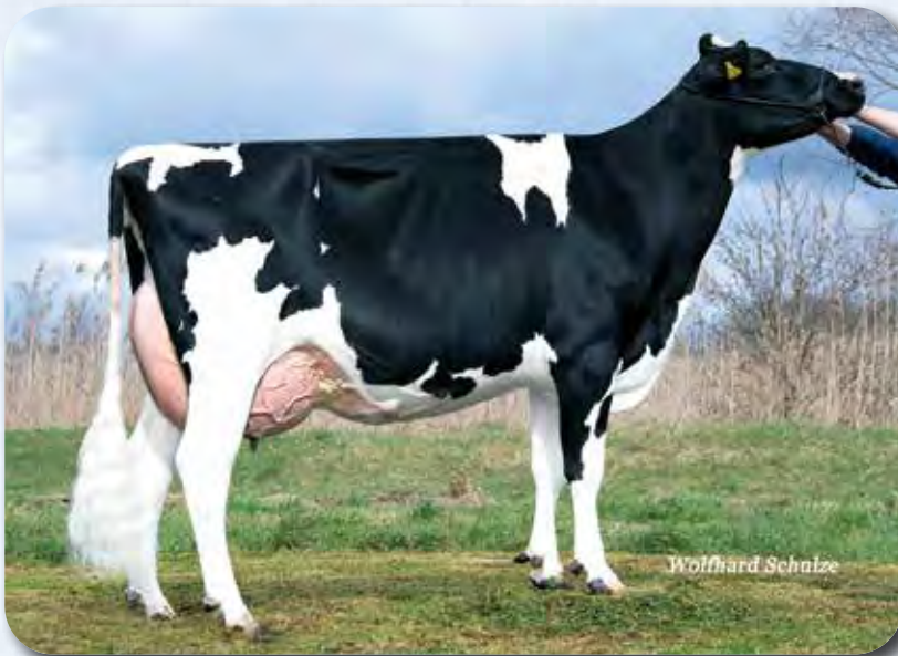
娘：A R H ゲーム(2産目) VG-86