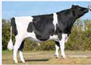
カツク ホルスタインズ ガムボア ET KAACK HOLSTEINS GAMBOA ET DEU123031041 H29.09.10生