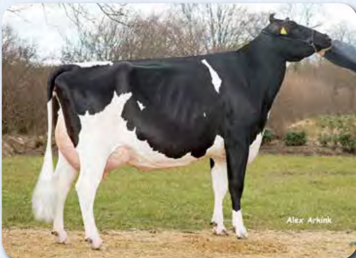
祖母：カツク ホルスタインズ デミュート VG-86

*RZG・RZM・RZE・RZS・RZN・RZR・乳用性・体・肢蹄・乳器は、100を平均とした場合の値