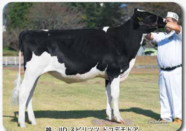
娘：IID スピリッツ ドコデモドA R4.10.9生 大分県 (有)アイ・アイ・ディ 所有 第84回大分県畜産共進会 第1部(12~15カ月) 名誉賞 リザーブ・ジュニア・チャンピオン