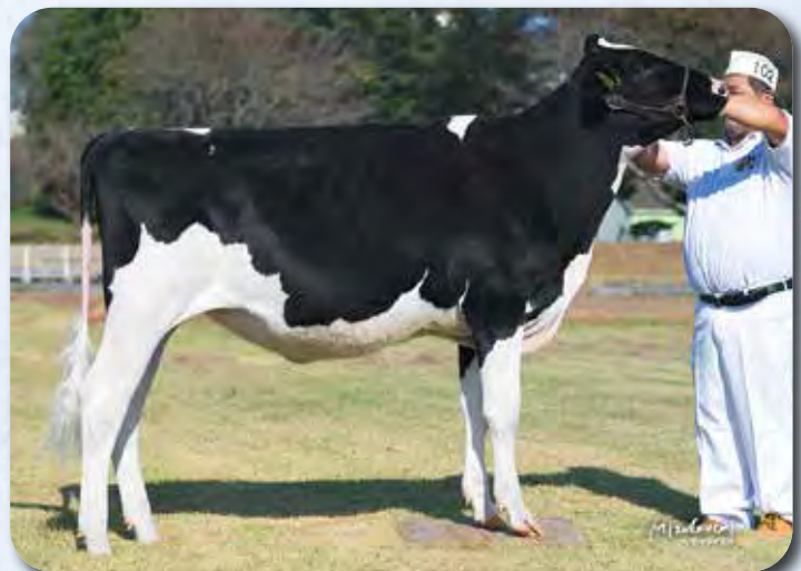
娘：IIDスピリッツ ドコデモドア R4.10.9生 大分県(有)アイ・アイ・ディ 所有 第84回大分県畜産共進会 第1部(12~15カ月) 名誉賞 リザーブ・ジュニア・チャンピオン