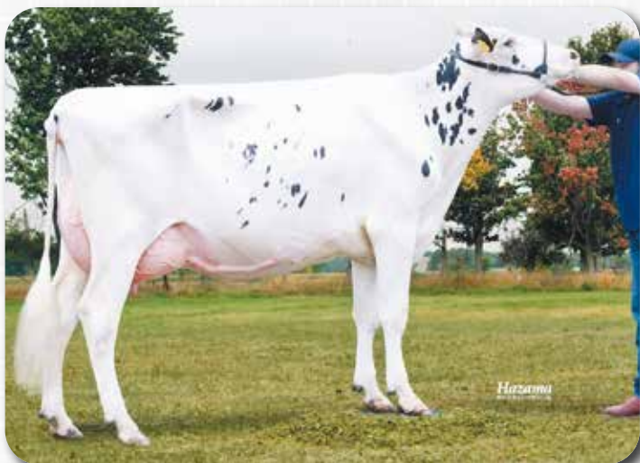
娘：ワカ スピリッツ マーシュ H30.9.2生 母の父：サクセス 音更町 河田 憲嗣氏 所有

娘牛表型平均 M11,631 F454 3.95% SNF997 8.60% P376 3.26% T80.0