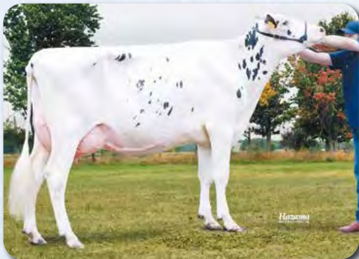
娘：ワカスピリッツ マーシュ H30.9.2生 母の父：サクセス 音更町 河田 憲嗣氏 所有

娘牛表型平均 M11,725 F457 3.95% SNF1,005 8.59% P379 3.25% T80.0