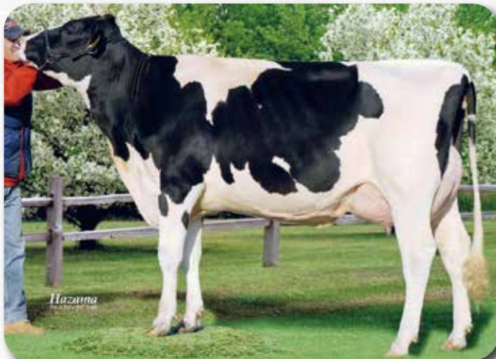
祖母: TLM ジャーデイン マリー VG-86

娘牛表型平均 M11,396 F468 4.16% SNF993 8.72% P381 3.36% T79.7