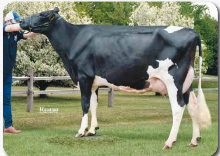
娘: ベル マスター ジェット

父: ジャーデイン 帯広市(有)十勝ライブストックマネージメント 所有 3.05才 2X 365 M18,431 F620 3.4% P614 3.3% SNF1,633 8.9%